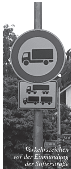
Verkehrszeichen vor der Einmündung der Stifterstraße

Die Verkehrskommission ordnete nun ein Verbotsschild für Sattelzüge oder LKW mit Zweiachsanhänger an, siehe Foto. Bei der Entscheidung musste allerdings beachtet werden, dass Fahrten von Feuerwehr-, Mülllastern und LKW-Anlieferungen an eine Firma in der Stifterstraße weiterhin legal möglich sind. Inwieweit solche Schilder die Fahrer von solchen Einfahrten abhalten, wird man sehen; zu hoffen ist, dass keiner mehr gedankenlos seinem Navi vertraut.