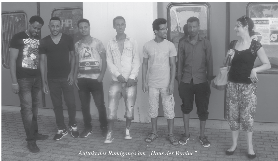
Auftakt des Rundgangs am „Haus der Vereine“