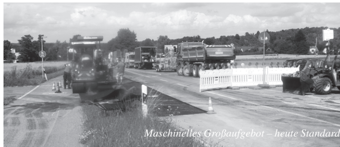
Maschinelles Großaufgebot – heute Standard

gezogen wird und spätere und damit deutlich teurere Schäden verursacht, durch das Landratsamt beauftragt.