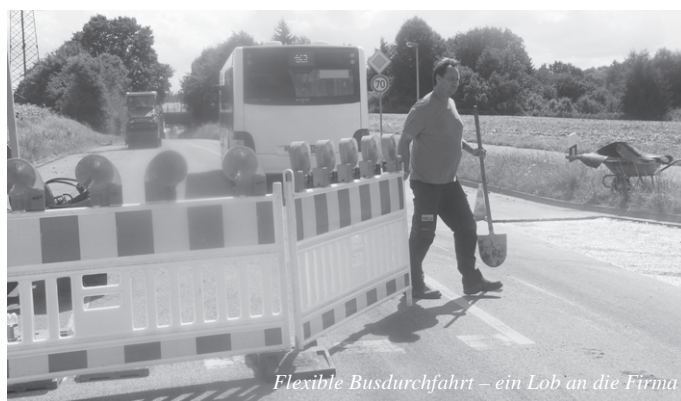
Flexible Busdurchfahrt – ein Lob an die Firma

Verbot für Sattelzüge und LKW mit Zweiachs-Anhänger