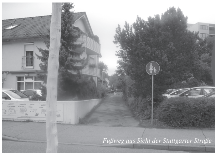
Fußweg aus Sicht der Stuttgarter Straße

Mit der Anbringung der Fußgängerbeschilderung ist die Maßnahme damit bauseitig abgeschlossen und der Weg freigegeben.