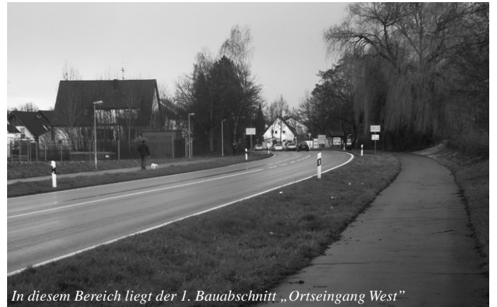
In diesem Bereich liegt der 1. Bauabschnitt „Ortseingang West“

OV Kik informierte das Gremium in der Februarsitzung, dass die Verkehrskommission (VK) die Frage von Standorten für die fest installierten „Blitzer“ im Laufe des Jahres aufgreift. Er wies aber darauf hin, dass, je nach Ausführung einer zeitgemäßen Anlage, entsprechende Mittel in sechsstelliger Höhe einzuplanen sind.