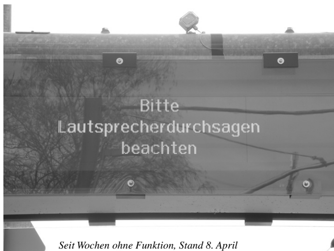
Seit Wochen ohne Funktion, Stand 8. April

Seit vielen Wochen beklagen Zugreisende, dass die elektronische Zug- bzw. Fahrplananzeige am Ötlinger S-Bahnhof offensichtlich defekt ist. Die Anzeigen werden per SMS auf die Anzeige übertragen. Auf Nachfrage teilte die Bahn mit, dass die Ursache am Wechsel zu einem anderen Provider liegt. Über den Zeitpunkt der Behebung des Problems – so die Auskunft der Bahn Ende März – lässt sich gegenwärtig noch nichts sagen.