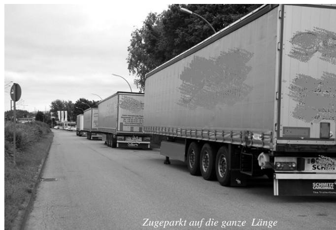
Zugeparkt auf die ganze Länge

Im Rahmen der gleichen Verkehrsschau wurde die Straße „Heimenwiesen“ ab der östlichen Brücke betrachtet. Dort gab es verstärkt