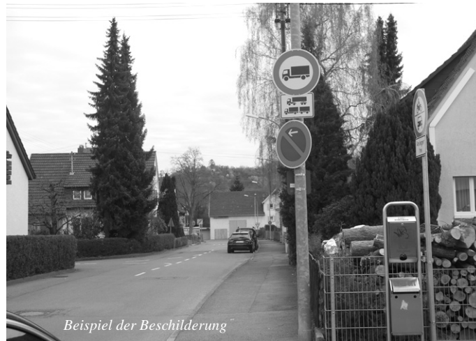
Beispiel der Beschilderung

se mit einem Achsabstand von weniger als einem Meter mit sich führen, passieren dürfen.