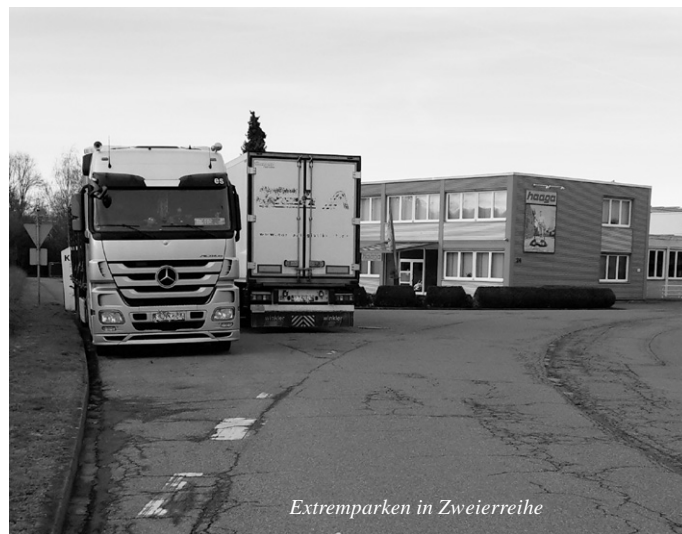
Extremparken in Zweierreihe

Die Übersichtlichkeit im Einmündungsbereich ist teilweise stark eingeschränkt durch dort parkende Lastzüge.